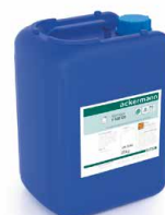
Reiniger und Klarspüler