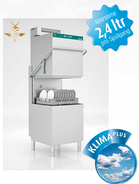
HGS 640 Klima Plus

Alles in Einer. Wirtschaftlichkeit, Design und Funktionalität auf höchstem Niveau.