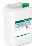
Reiniger und Klarspüler