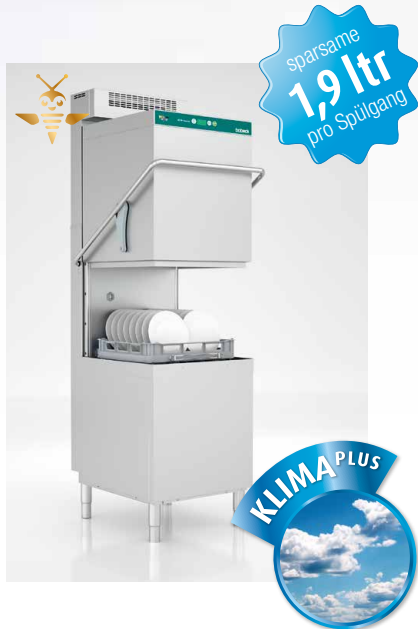
HGS 540-1 Klima Plus HGS 540-1 E Klima Plus

Spürbar besseres Klima. Schluss mit Dampf und feuchten Räumen.